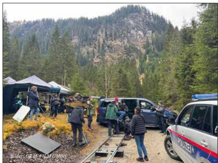
Bei Dreharbeiten für den Film „Der Geier“ in der Knappenwelt Angertal der Via Aurea