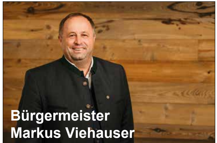
Bürgermeister Markus Viehauser

Die Arbeiten rund um den neuen Kindergarten in Lafen gehen zügig voran. Man befindet sich nach wie vor im Rahmen des vorgegebenen Zeitplanes, sodass einer Wiedereröffnung des Kindergartens im April 2027 derzeit nichts im Wege steht. Die Vergaben der einzelnen Gewerke sind in vollem Gange. Unter Berücksichtigung der Bestimmungen des Bundesvergabegesetzes ist die Gemeinde bemüht, dass vor allem einheimische Firmen bei der Umsetzung der Herstellungsmaßnahmen berücksichtigt werden. So werden zurzeit die Holzbau-Meisterarbeiten offiziell vergeben und darf ich in diesem Zusammenhang mitteilen, dass den entsprechenden Auftrag ein heimisches Unternehmen erhalten wird.