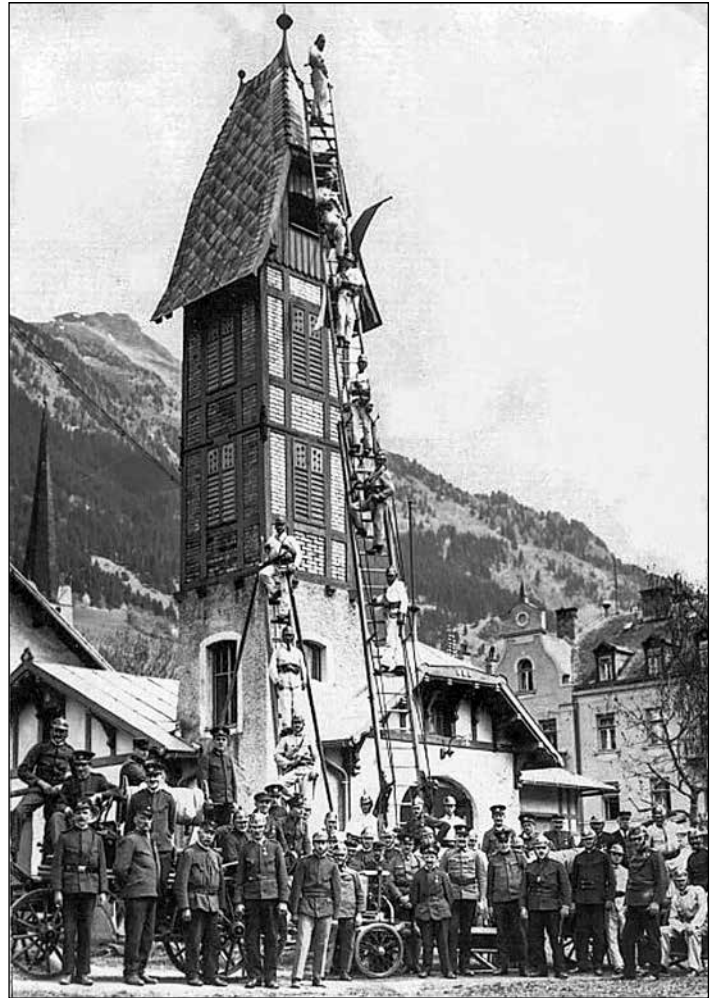
1928: Das Zeughaus mit Schlauchturm stand im Markt Hofgastein hinter dem „Wickingerhof“, ehemals: Kaiser Franz Josef I. Jubiläums-Zeugstätte.