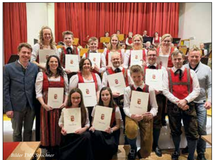
Bilder TMK Strochner