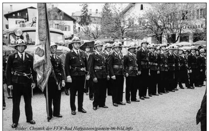
Florianifeier 1966