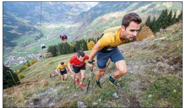
Im Bild aus 2025: 1200 Höhenmeter auf einer Distanz von 3,3 Kilometern, steiler geht's nicht.

hoher Umsetzungsqualität zu einem der beliebtesten Bergläufe im Alpenraum entwickelt. Und die zahlreichen helfenden Hände vom Team Fulseck Trophy werden diesem Anspruch sicher auch heuer wieder gerecht werden.