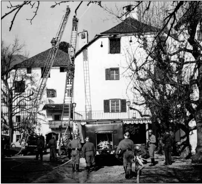
Gasteinertal-Übung 26.10.1968 beim Weitmoserschlossl

Einerseits bleibt den Bürgerinnen und Bürgern sowie unseren Gästen die regelmäßige Sirene erspart. Andererseits bleibt damit vieles unsichtbar.