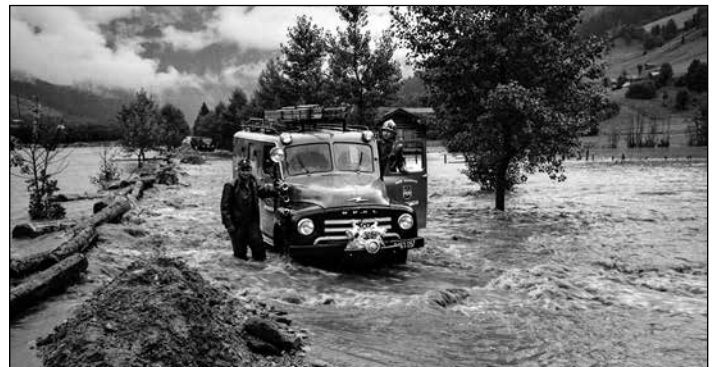
Hochwasserkatastrophe September 1965