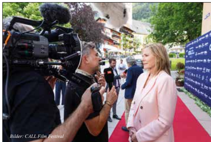
Im Interview mit Kim Cattrall